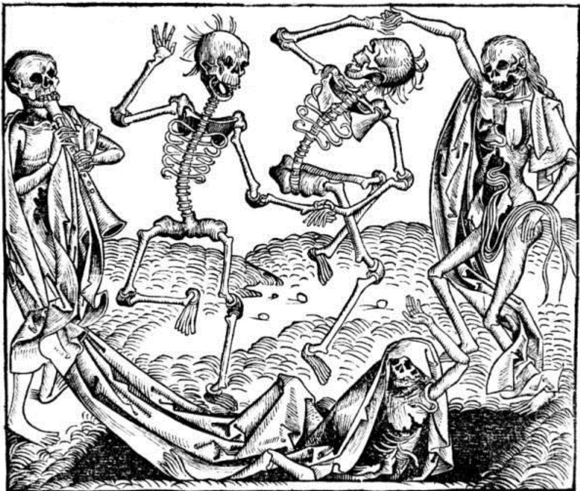
Wolgemuth Tanz der Gerippe 1493