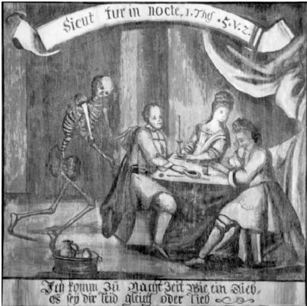
Totentanz aus Wondreb/Opf. (Deckengemälde)

In vielen Totentänzen, auf Wandgemälden oder vor allem in Büchern, sind die Begleittexte länger, es sind Gespräche zwischen Tod und dem Menschen eines bestimmten Standes. Die Menschen wehren sich, der Tod bleibt unerbittlich. Ein Beispiel „Der doten dantz mit figuren clage und antwort schon von allen staten der werlt“ (Oberdeutscher achtzeiliger oder jüngerer Totentanz) ca 1486.